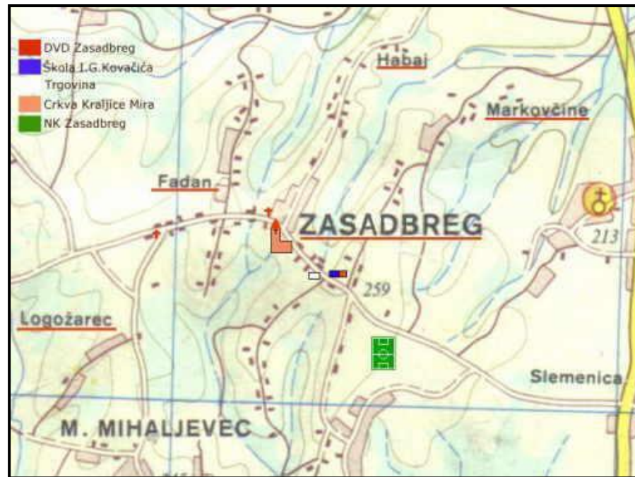
Slika 1: Plan Zasadbrega

Stariji mještani pričaju još jednu priču. Priča je to o tajanstvenom grofu Fadanu koji je u ulici koja nosi njegovo ime navodno imao dvorac. Nažalost, mještani ne znaju ni ime grofa. Ipak, priča nas je zainteresirala i odlučili smo potražiti povijesne tragove grofa Fadana u Zasadbregu. Moramo priznati da to nije bio nimalo lak zadatak, ali na kraju smo zadovoljni jer smo naučili puno o povijesti sela u kojem živimo, a rezultati do kojih smo došli čine nam se i te kako zanimljivi za malo selo poput Zasadbrega.