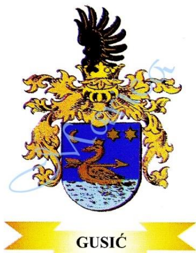
Plemićki grb Gusića