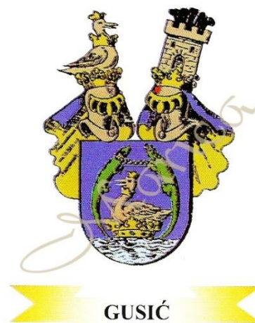
Barunski grb Gusića " de Turan